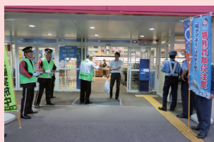
火災予防啓発運動