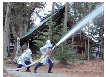
文化財防火デーに合わせた消火訓練

【優待施設】 ふれあいセンターふじみ、清泉荘、八峯苑鹿の湯、道の駅信州葛木宿つたの湯、ゆーとろん水神の湯