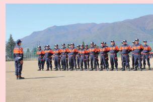
春・秋季総合訓練