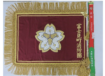
富士見町消防団旗

このように様々な活動を行う地域の担い手である消防団員と、消防団員を支える家族に感謝の気持ちとして、町では新たに8つの支援を行います。申請には手続きが必要な事業がありますので、希望される場合はご連絡ください。